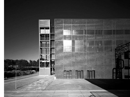
Umbau Kesselhaus zum Designmuseum