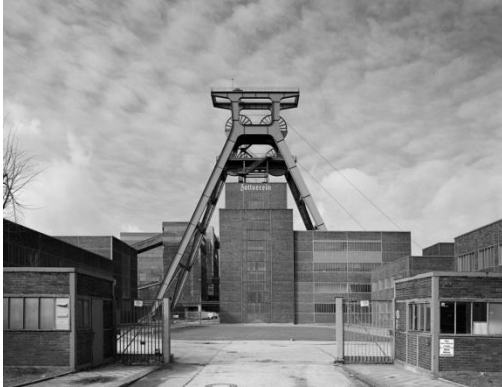
Sanierung sämtlicher Hallen Schacht XII