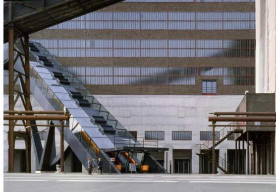
Umbau Kohlenwäsche zum Ruhrmuseum