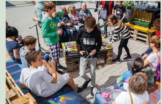
Beispiel für eine Freiraum-Insel

Freitag 25. August 2017 von 18.00 bis 20.00 Uhr