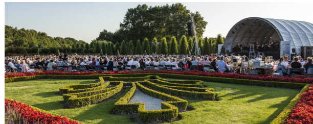
Die Kamper Nacht am Kloster Kamp

Das Kloster wurde 1123 als erstes Zisterzienserkloster auf deutschsprachigem Boden gegründet. Das weitläufige Areal mit Abteikirche, Museum, Klosterladen und Kräutergarten ist ein überregional beliebtes Ausflugsziel. Sie können es auf eigene Faust oder im Rahmen einer Führung entdecken ( Infos und Buchung beim Geistlichen und Kulturellen Zentrum Kloster Kamp e.V. unter Telefon: 02842 927541).