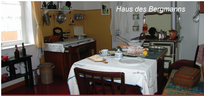
Haus des Bergmanns