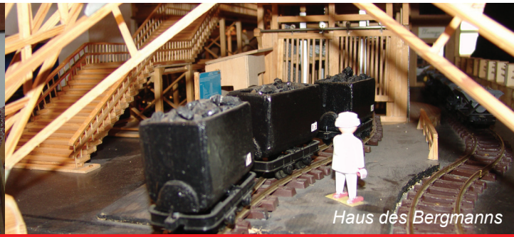
Haus des Bergmanns