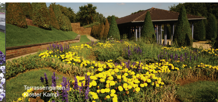
Terrassengarten Kloster Kamp