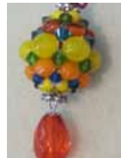
Siehe Foto Deckblatt