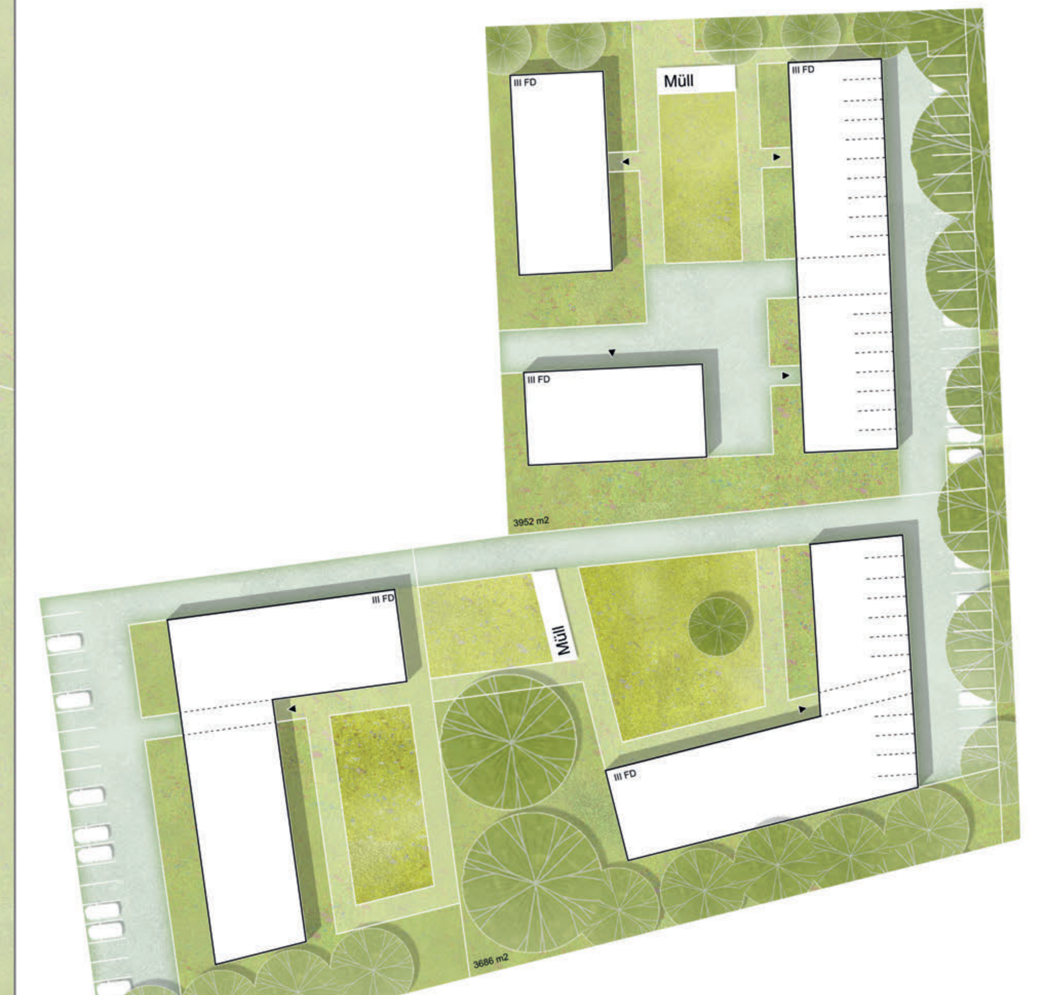
Planungsvariante für Teilgebiete 1b/1c Wohnhöfe Saalhofer Straße (Geschosswohnen) Stellplatzanordnung oberirdisch (keine Tiefgarage)

Teilgebiet 3 Doppelhaussetzung (Flächen Vivawest Wohnen) Geschossigkeit: II Grundstücksgößen: ca. 240 - 290 m 2 Grundflächen: (Gebäude-Footprint) ca. 70 m 2 Dachform: Satteldach Neigung 30 - 40° Traufhöhe: Einheitsdach Vordachtiefe: 1,50 - 2,00 m Fassadenmaterial: Verblendes Putz, Holz Farbe: Beige, Braun u. Graue (siehe gemäß Farbkonzept)